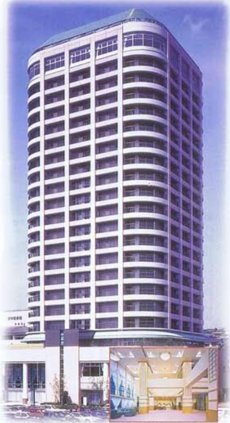
●エントランスホール(1F)