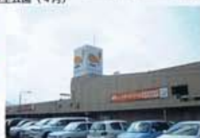
●ショッピングモールながま