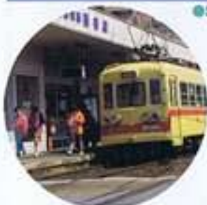
●筑豊電鉄通谷電停