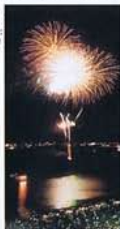
●通賀川 河川敷 (花火大会: 8月)